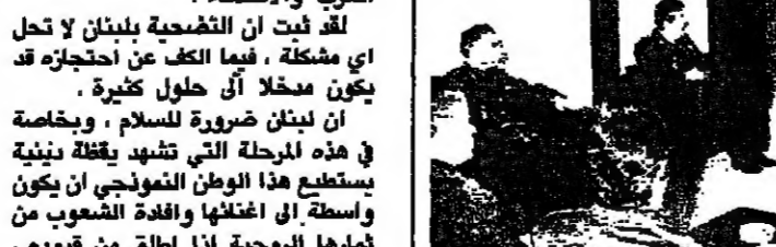
الرئيس الجميل يستقبل قادة قوى الامن الداخلي